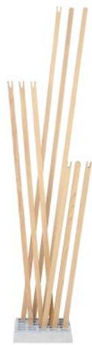
Esche unbehandelt ash untreated