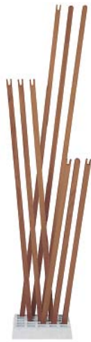
Nussbaum geölt walnut oiled