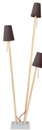
dunkelbraun dark brown