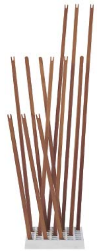
Nussbaum geölt walnut oiled