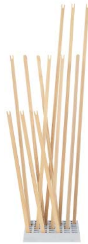
Esche unbehandelt ash untreated