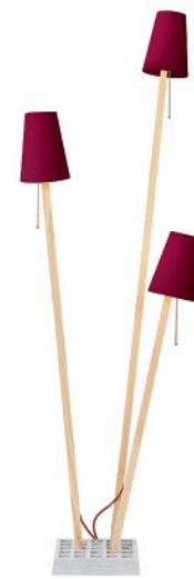
weinrot ruby coloured

Originalfarben können von den dargestellten Farben abweichen. The original colours may vary in comparison to the shown colours.